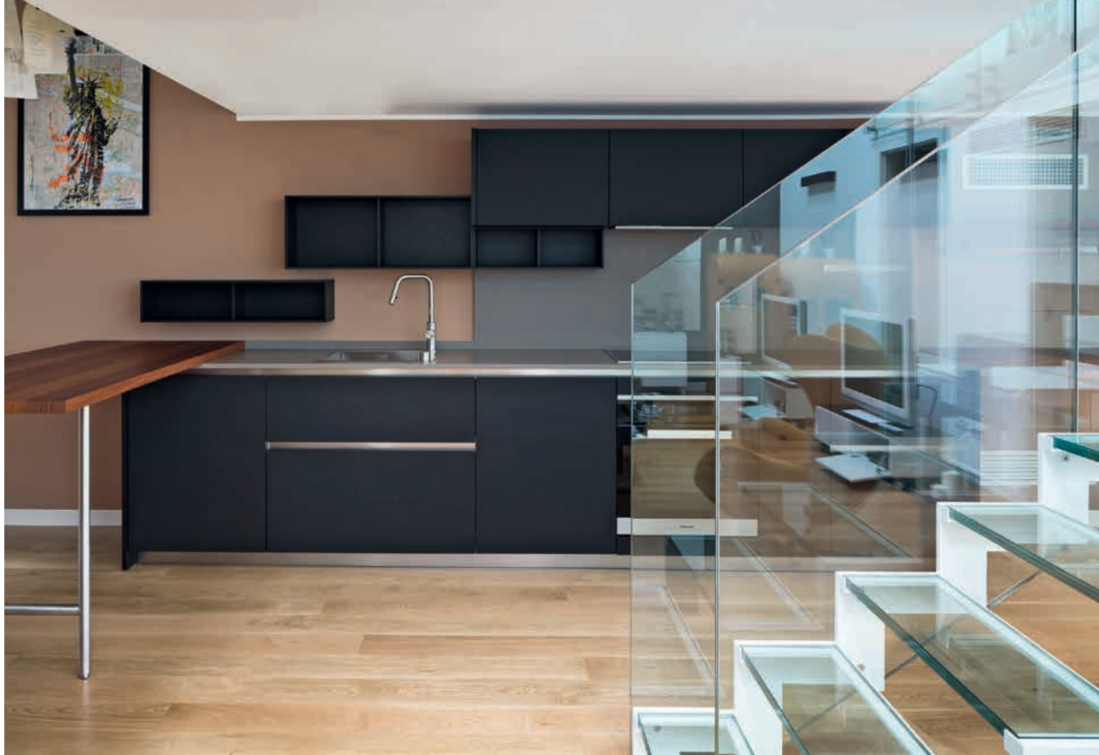
XILA / Cucina Kitchen pag. 130 131, 132 133, 134, 135