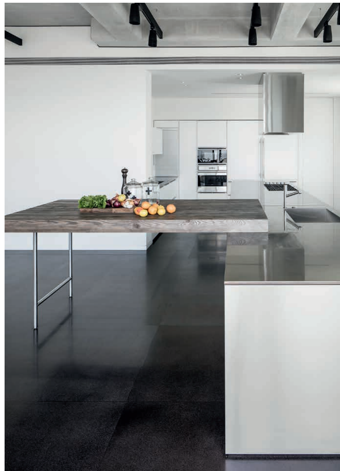
CASE SYSTEM / Cucina Kitchen XILA / Cucina Kitchen DUEMILAOTTO / Tavolo a penisola Peninsula table CEILING / Cappa Hood pag. 38, 39