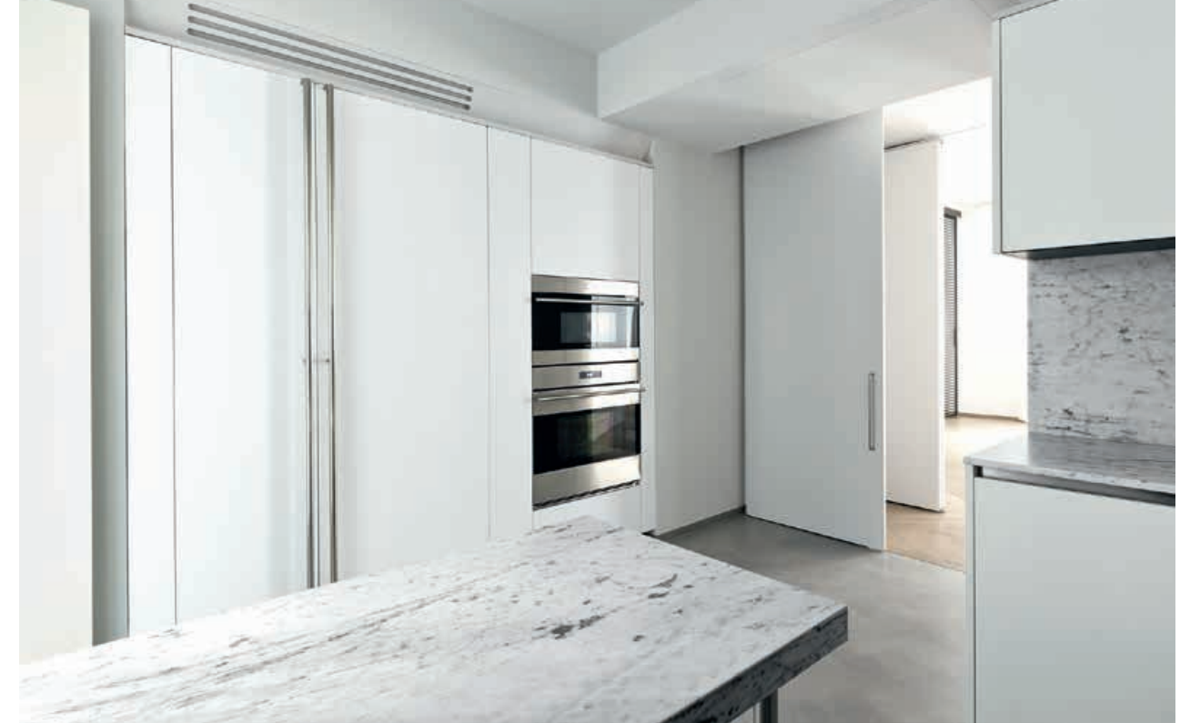
XILA / Mobili Cabinets DUEMILAOTTO / Tavolo Table pag. 156 157, 158, 159