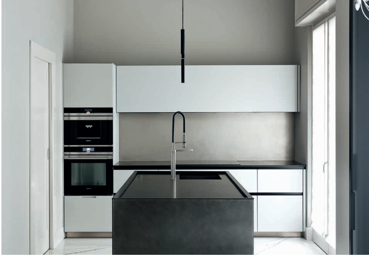
XILA / Cucina Kitchen K20 / Cucina Kitchen pag. 140 141, 142 143, 144, 145, 146 147