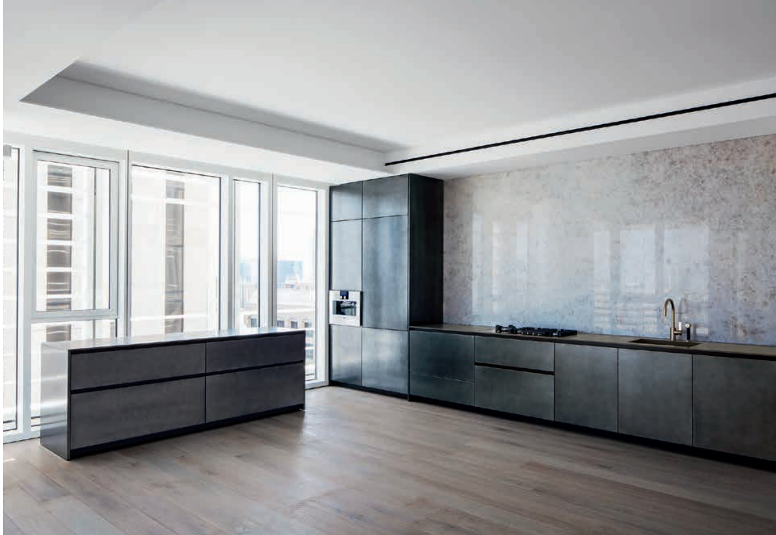
XILA / Cucina Kitchen pag. 40 41, 42, 43