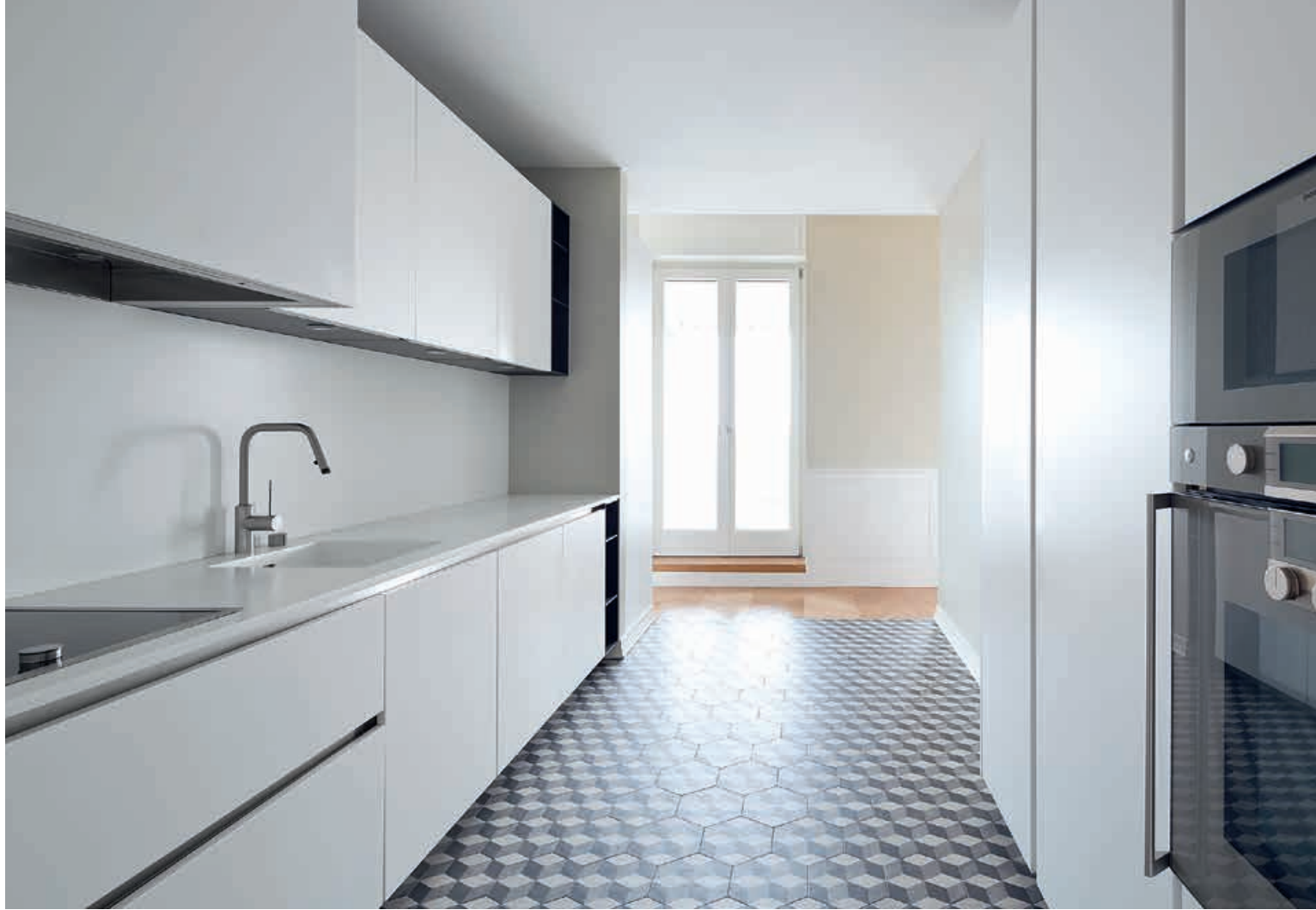
XILA / Mobili Cabinets pag. 152 153, 154, 155