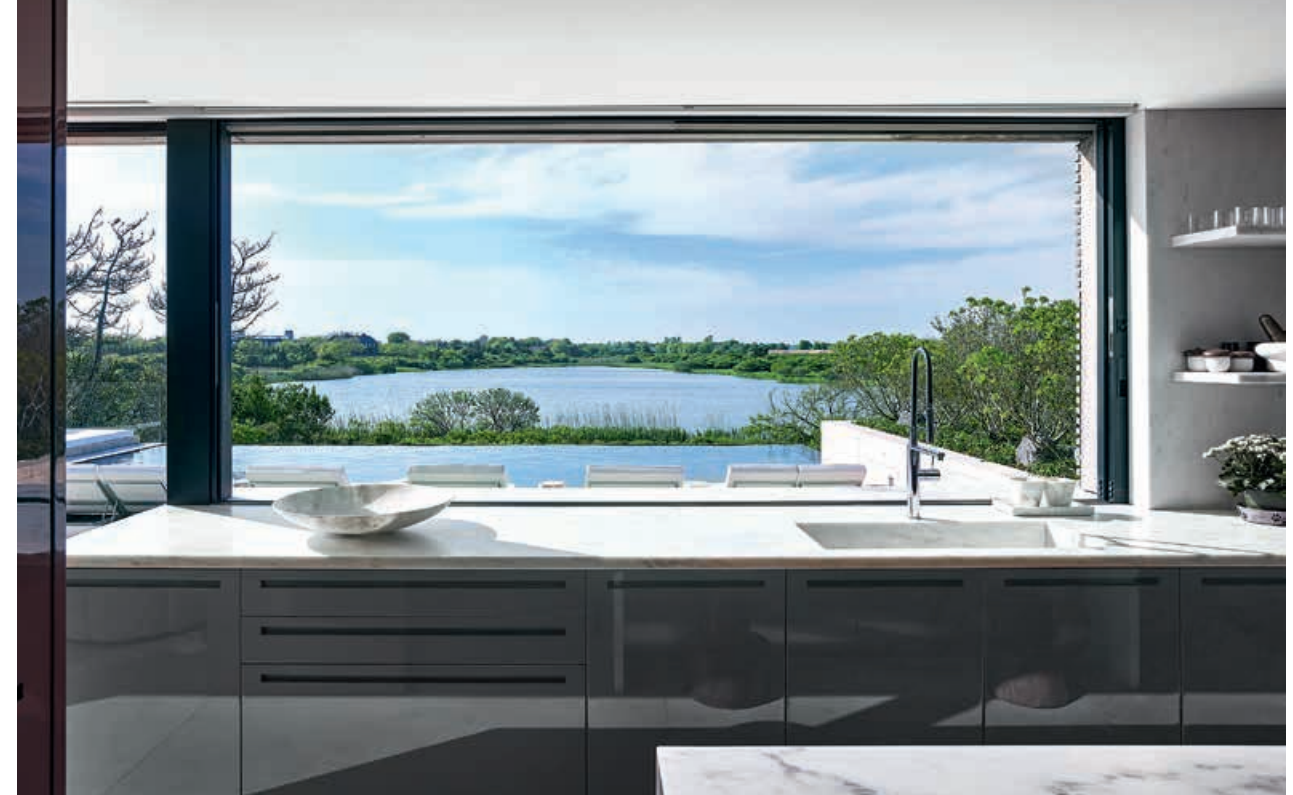
XILA / Cucina Kitchen HIDE / Colonne Tall units pag. 04 05, 06 07, 08, 09