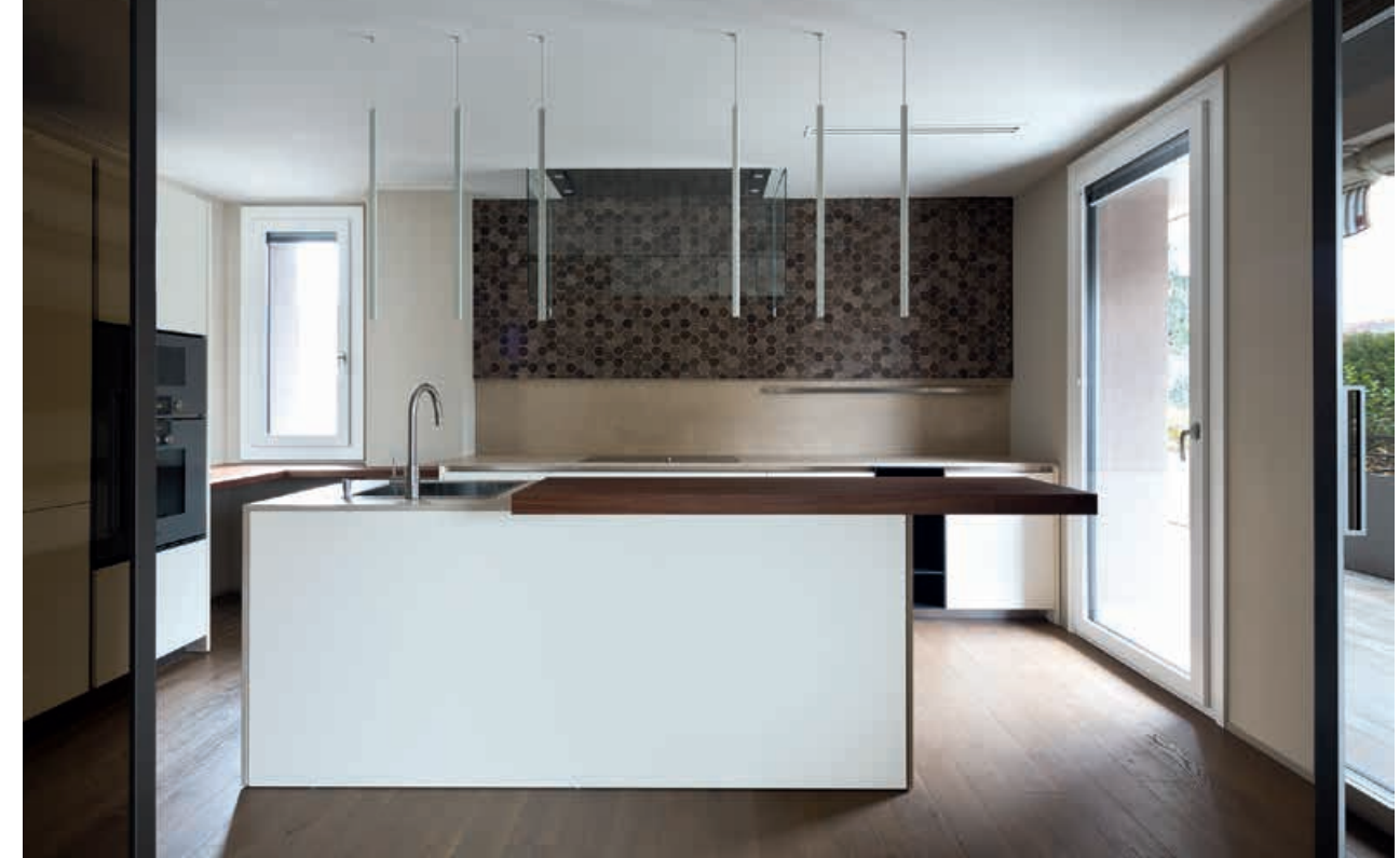
XILA / Mobili Cabinets pag. 161, 162 163, 164, 165