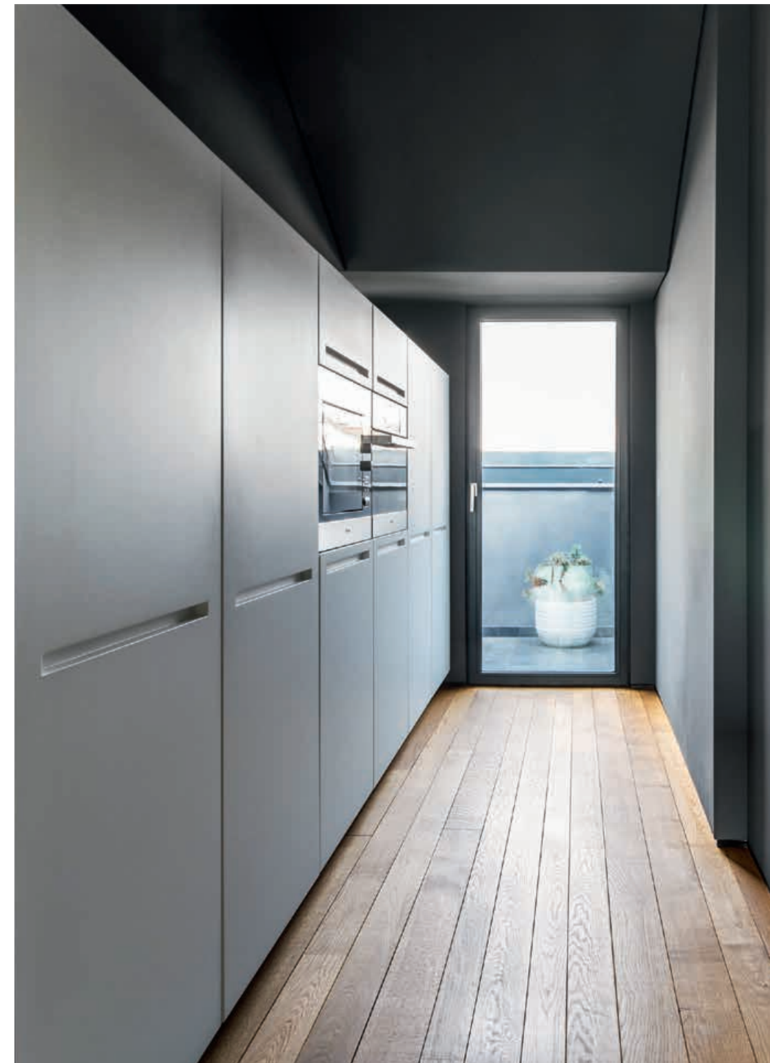
LT / Cucina Kitchen W1 / Rubinetto Tap STATION / Sgabello Stool pag. 44 45, 46, 47