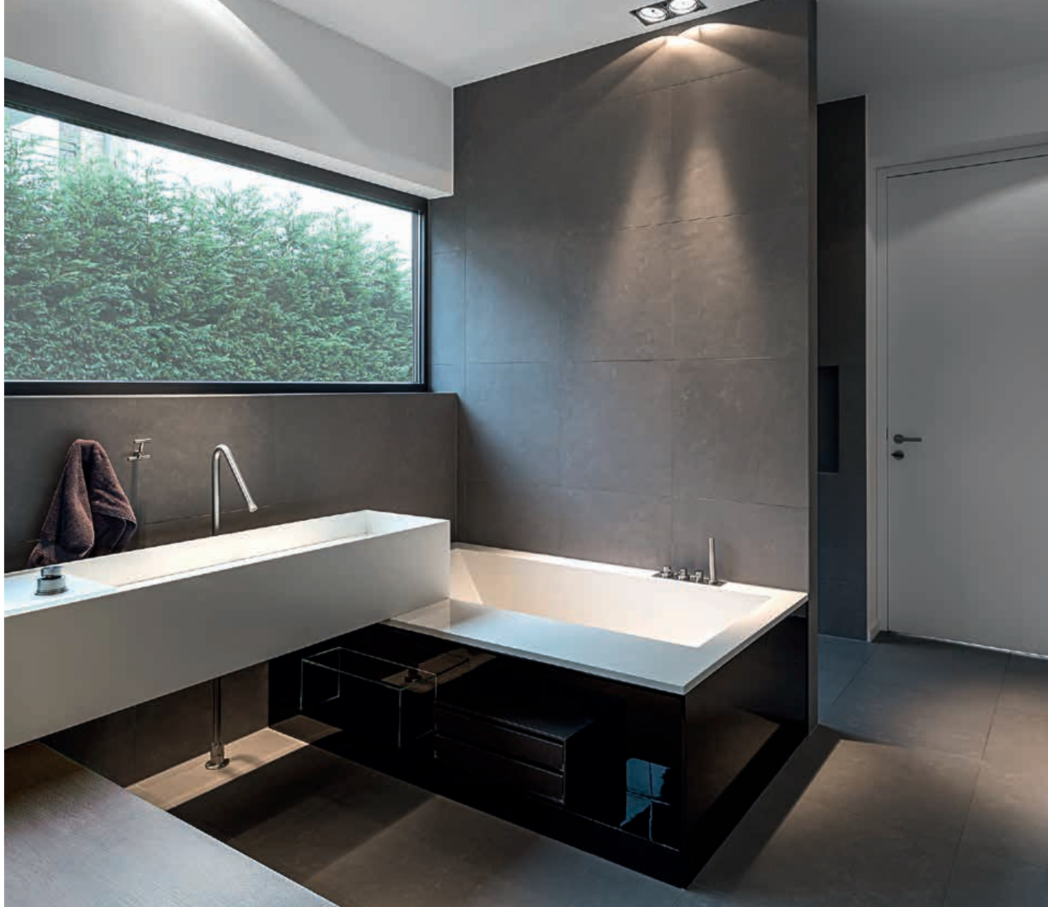
ZONE / Lavabo Washbasin UNIVERSAL / Mobili Cabinets MINIMAL / Rubinetti e Accessori Taps and Accessories SWIM / Vasca Bathtub VENEZIANA / Specchio Mirror pag. 254 255, 256, 257