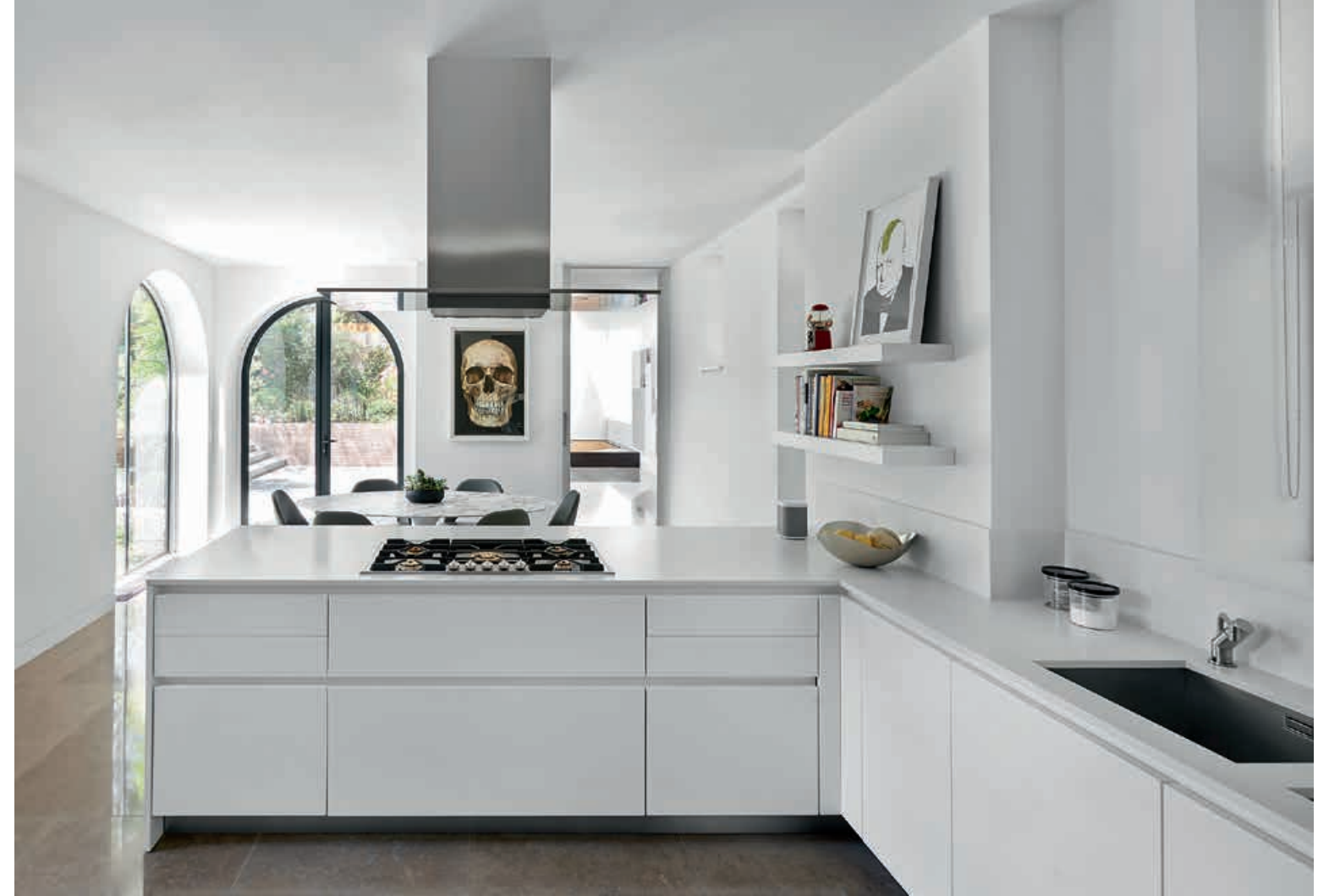
XILA / Mobili Cabinets FLYLINE / Cappa Hood pag. 60 61, 62 63, 64, 65