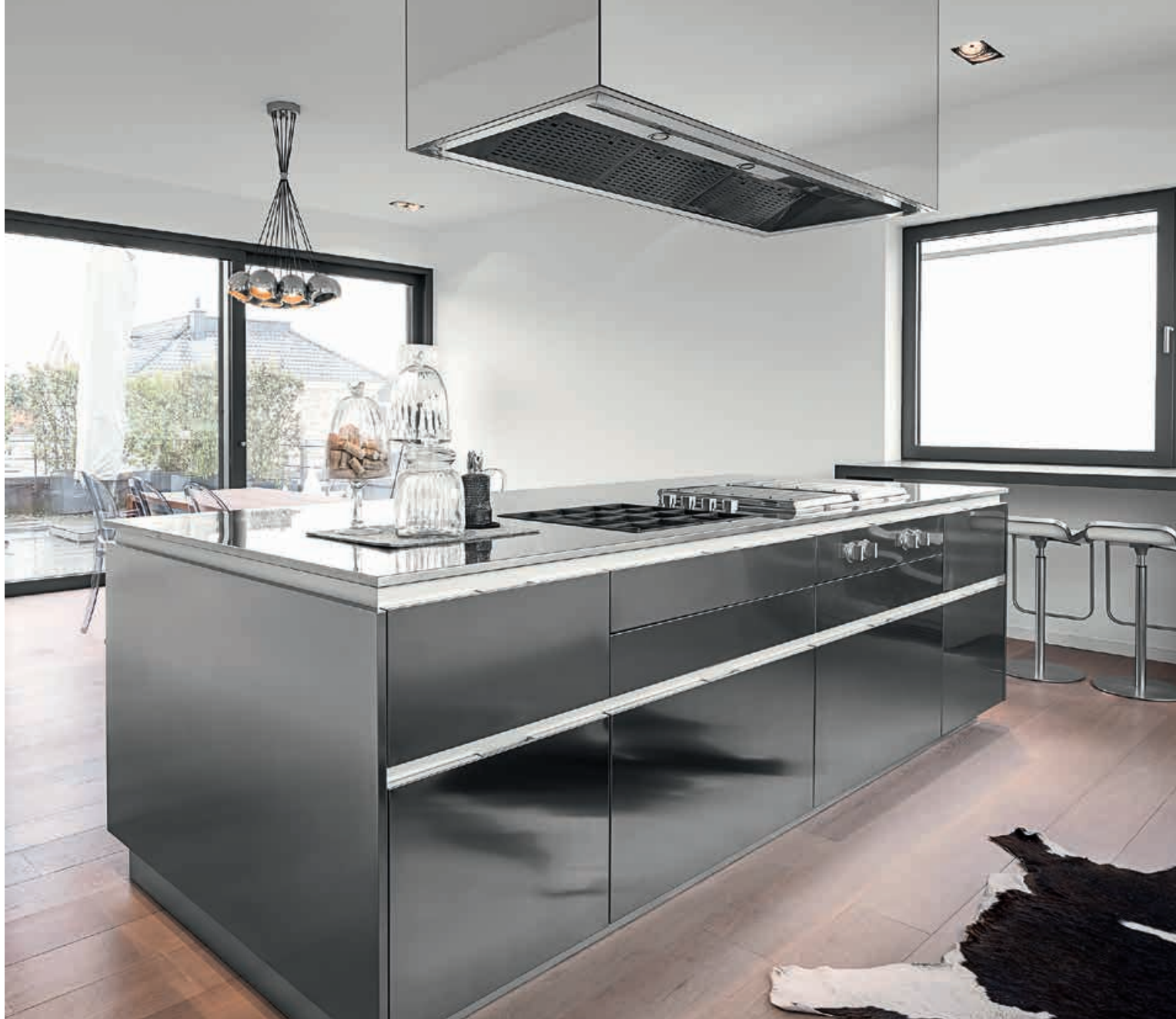
XILA / Cucina Kitchen PROGRAMMA STANDARD / Mobili con maniglia X12 Cabinets with X12 handle CEILING / Cappa Hood pag. 184 185, 186, 187