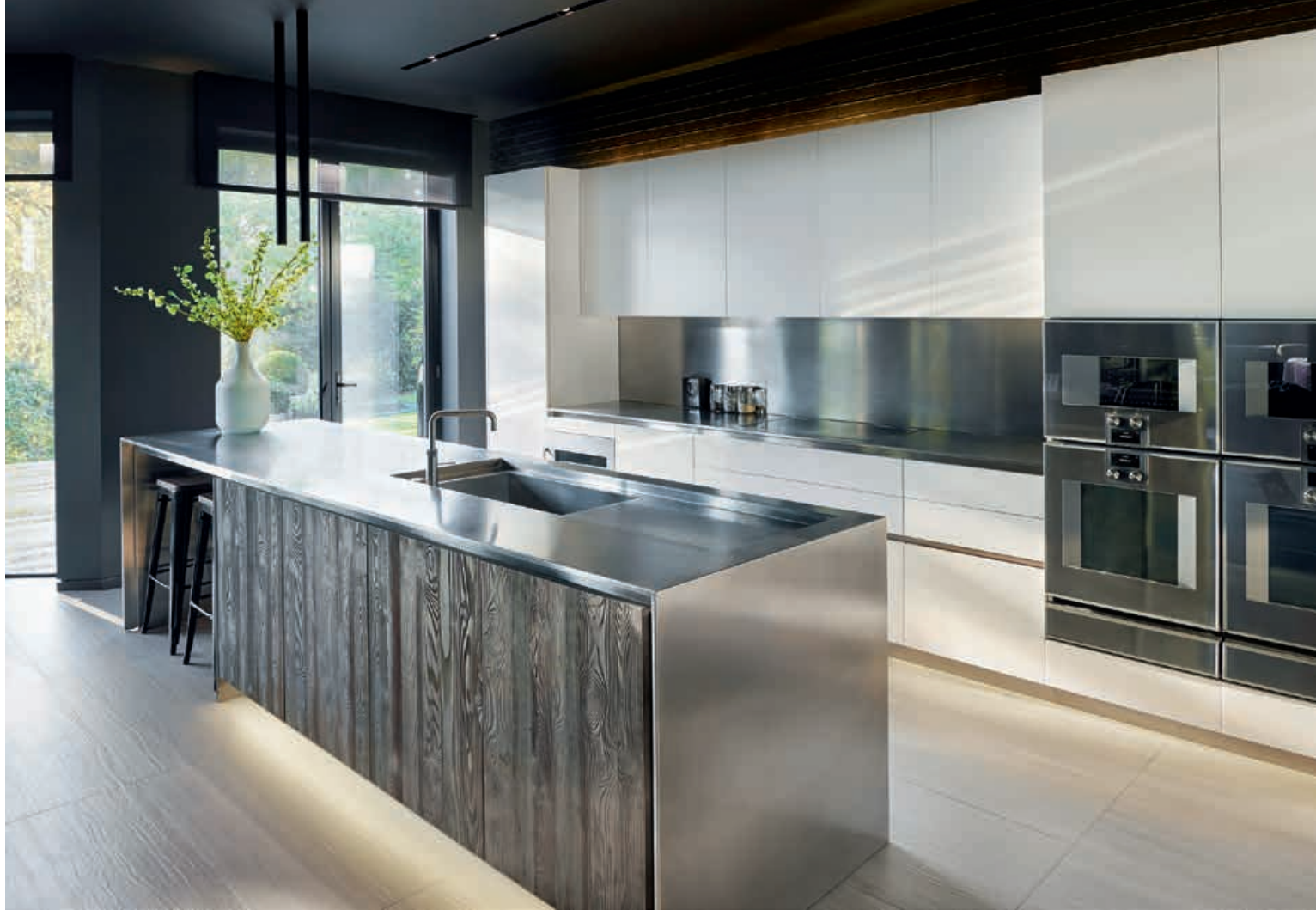
APRILE / Cucina Kitchen XILA / Cucina Kitchen pag. 66 67, 68, 69