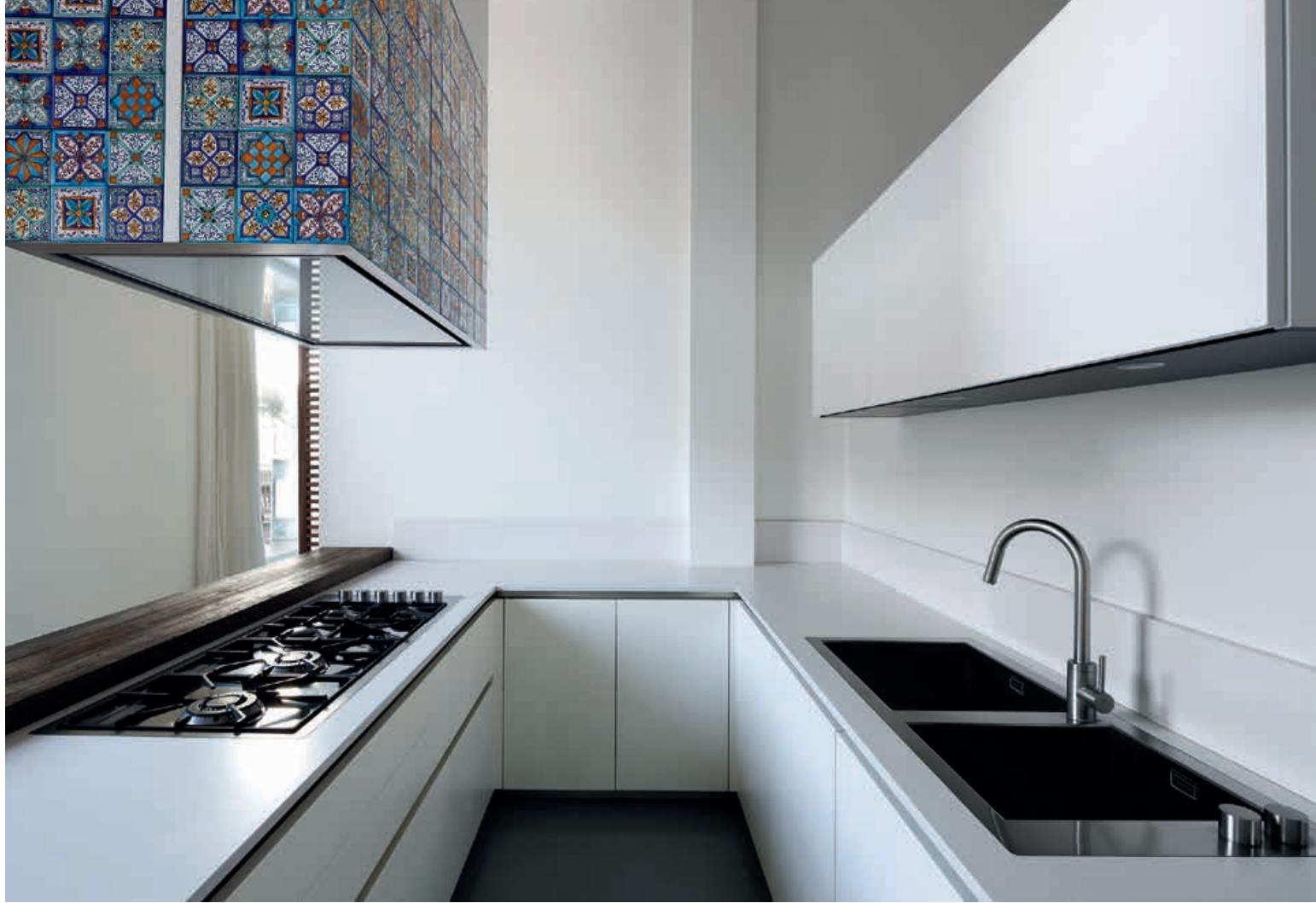
XILA / Cucina Kitchen TILE / Cappa Hood pag. 148 149, 150, 151