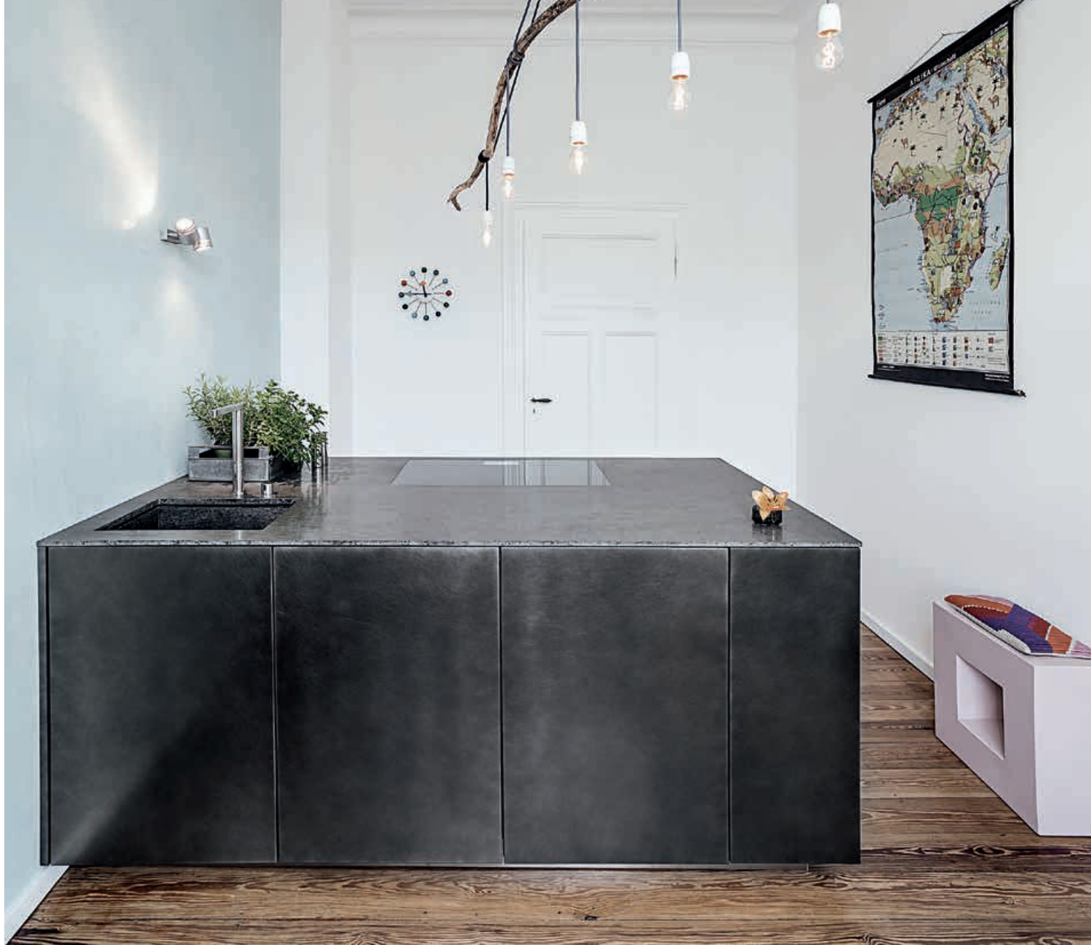
APRILE / Cucina Kitchen W1 / Rubinetto Tap pag. 70 71, 72, 73