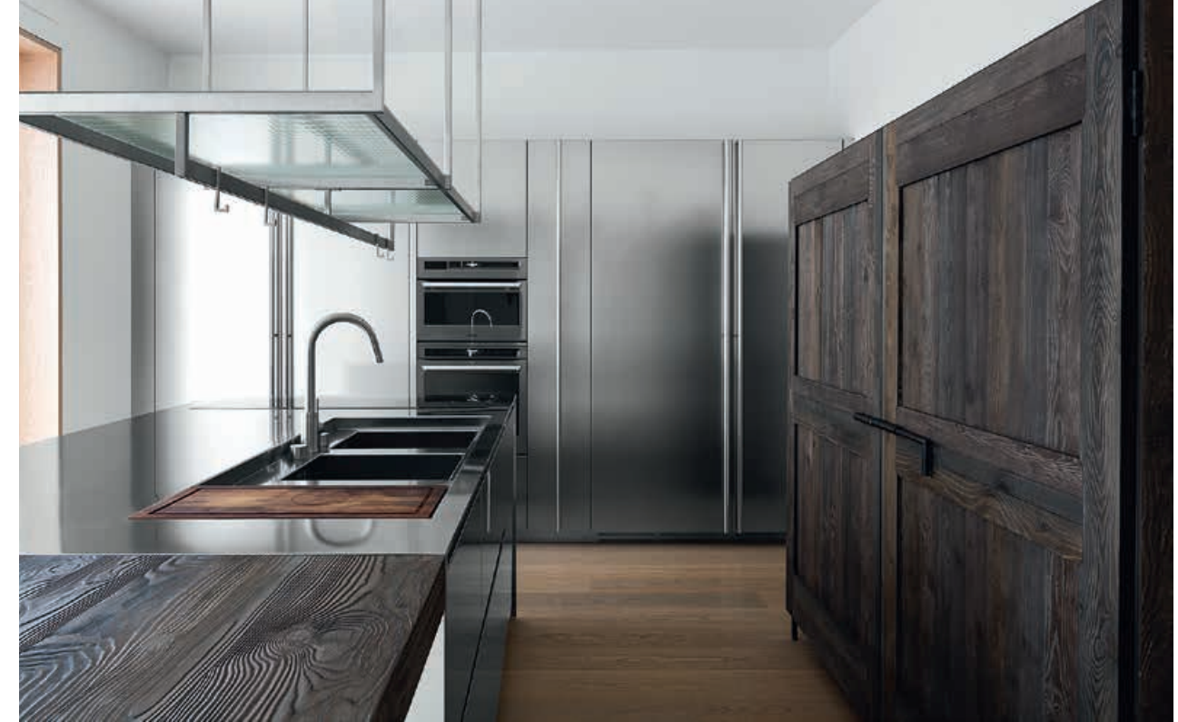
XILA / Cucina Kitchen HIDE / Colonne Tall units MADIA / Mobili Cabinets OPEN / Mensola Shelf DUEMILAOTTO / Tavolo a penisola Peninsula table pag. 136, 137, 138, 139