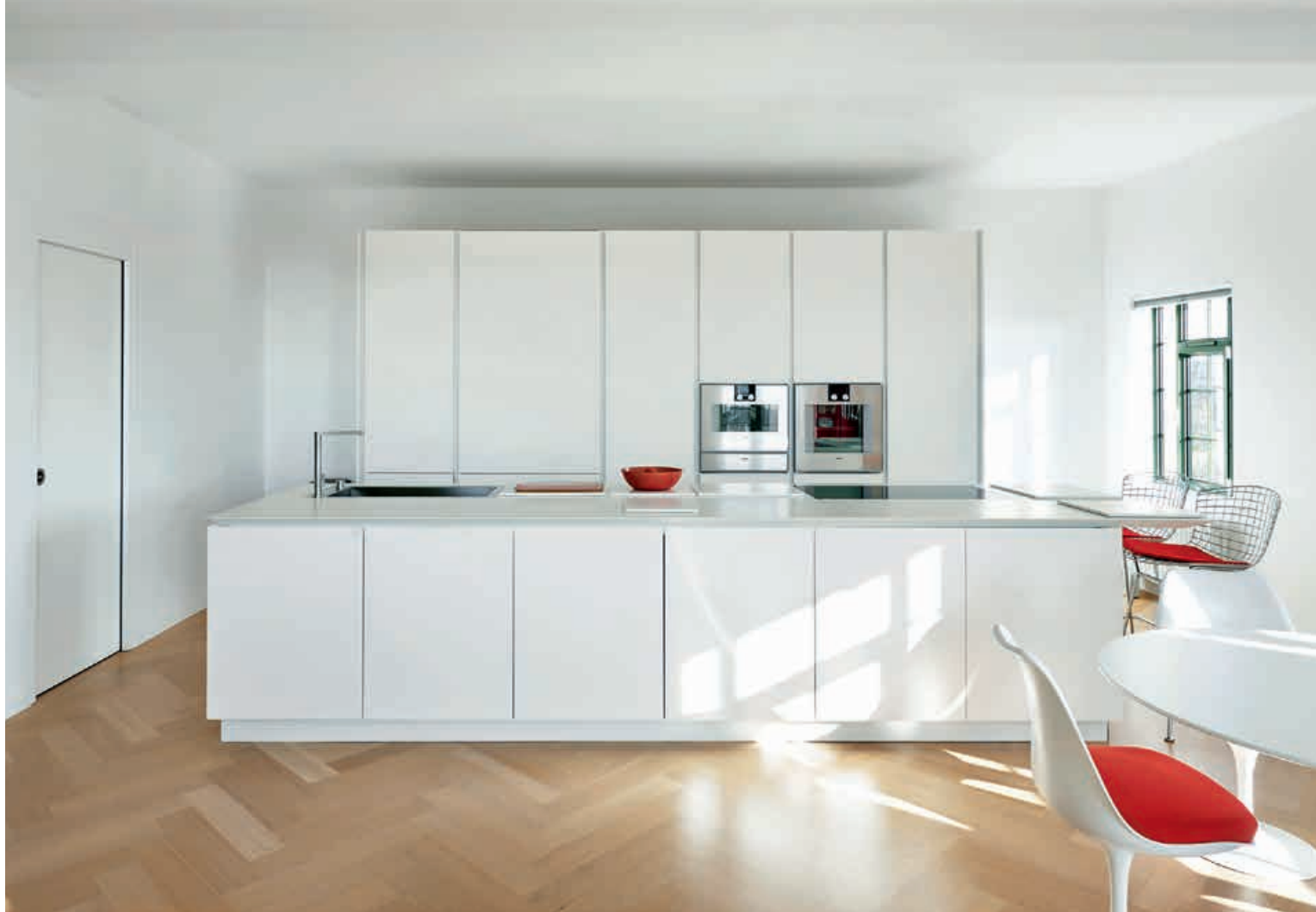
K14 / Cucina Kitchen XILA / Colonne Tall units W1 / Rubinetto Tap pag. 56 57, 58, 59