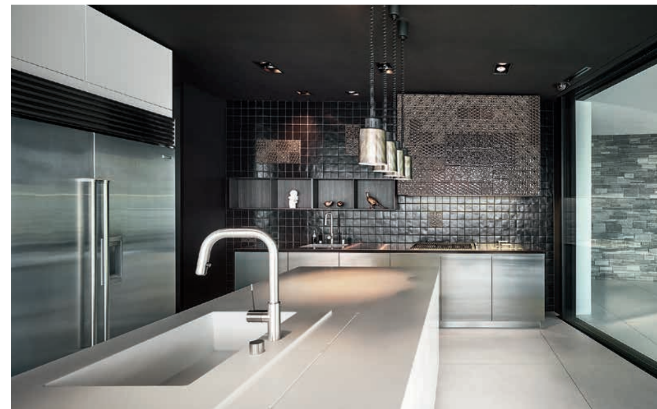
K14 / Cucina Kitchen TILE / Cappa Hood pag. 180 181, 182, 183