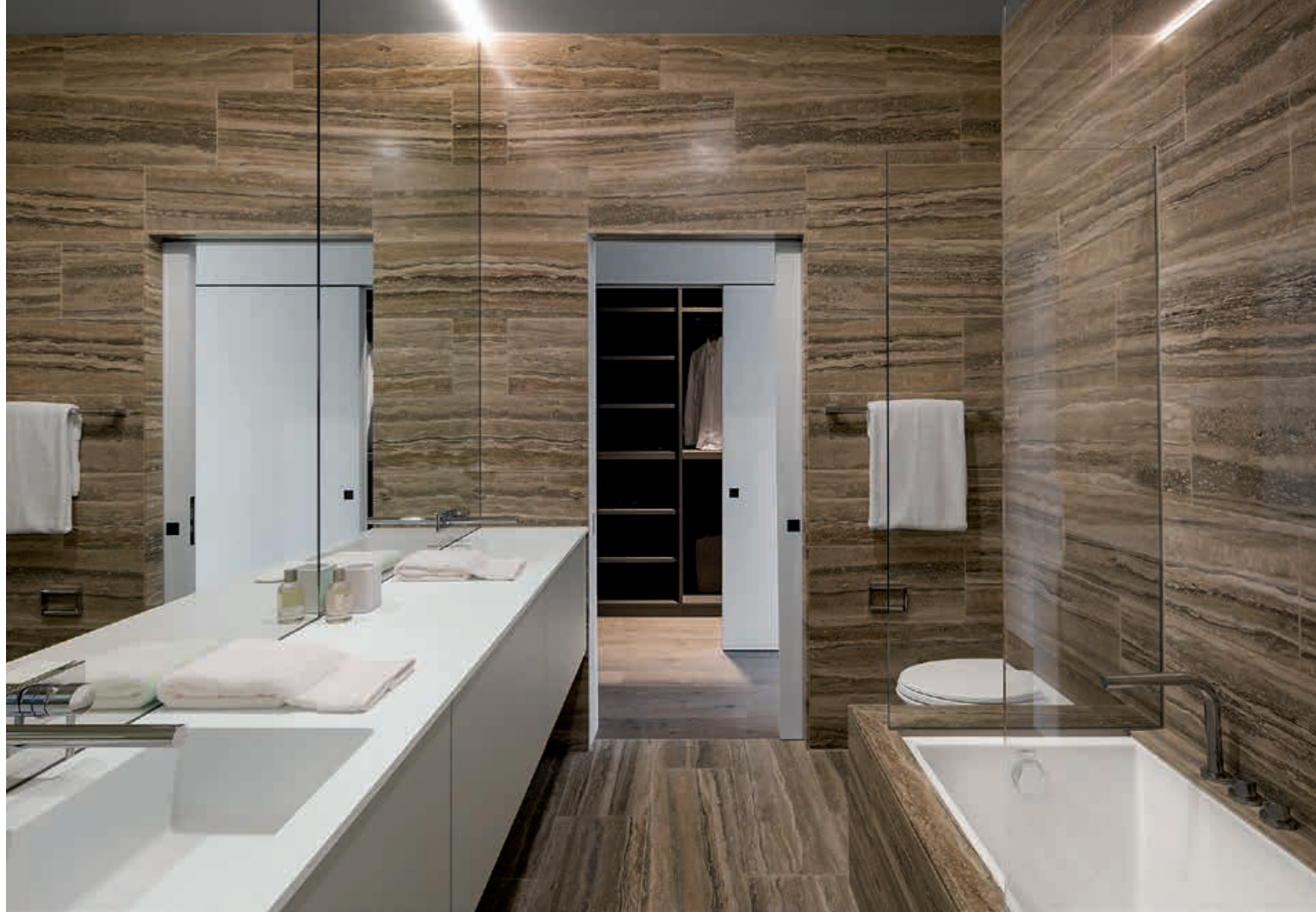
I FIUMI ST / Mobili Cabinets UNIVERSAL / Lavabi Washbasins pag. 228 229, 230