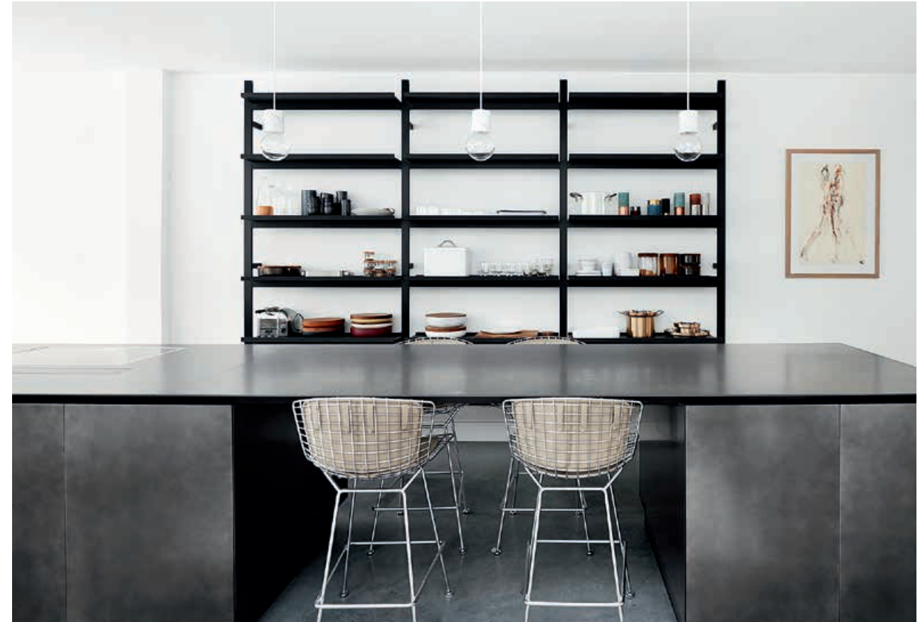
K14 / Cucina Kitchen W1 / Rubinetto Tap BROMPTON / Libreria Bookcase pag. 22 23, 24 25, 26, 27