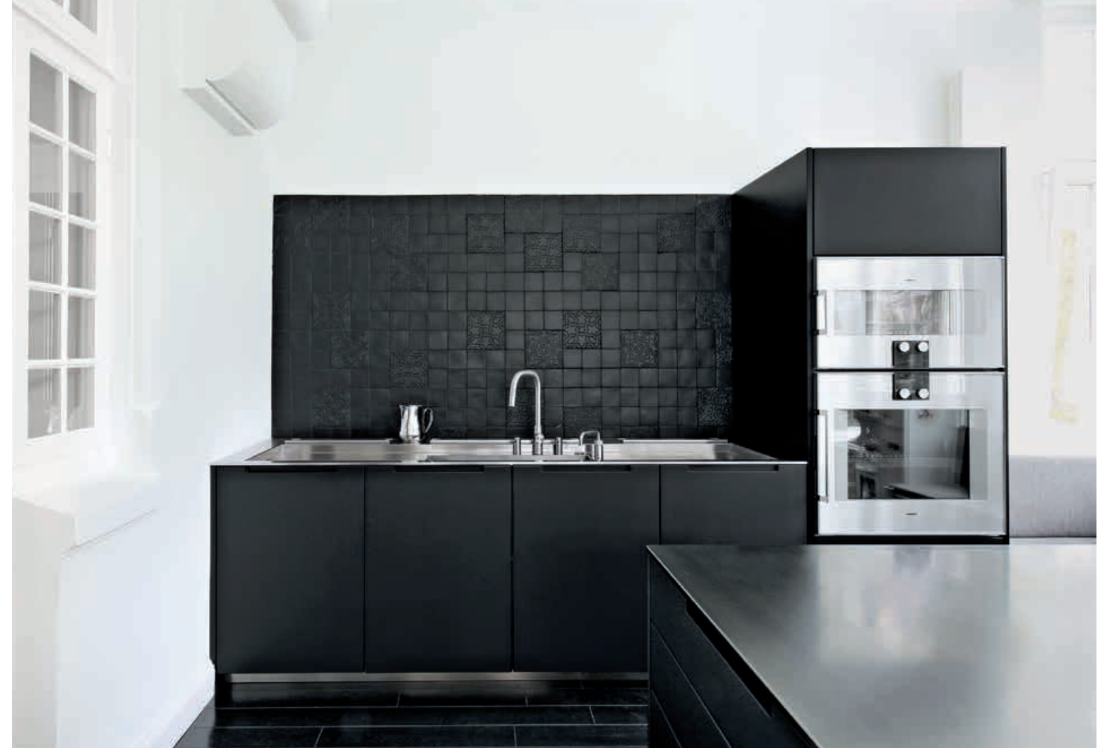
APRILE / Cucina Kitchen BROMPTON / Libreria Bookcase pag. 89, 90, 91