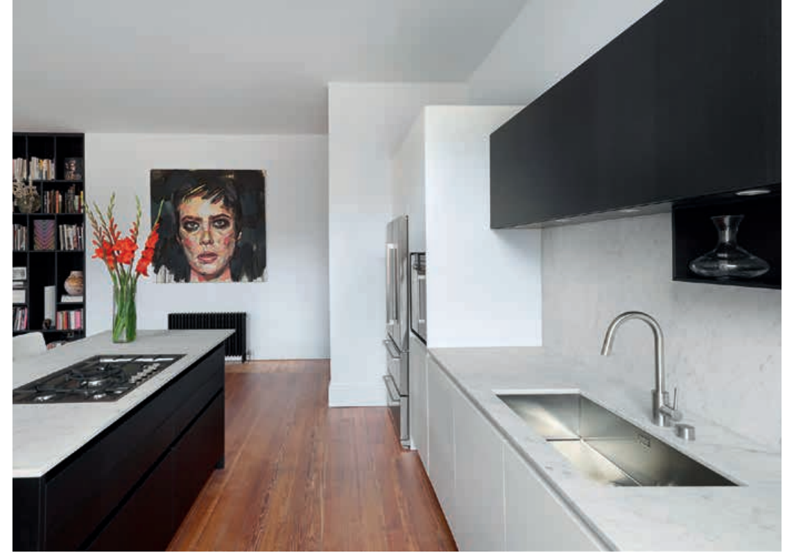
XILA / Cucina Kitchen pag. 48 49, 50, 51