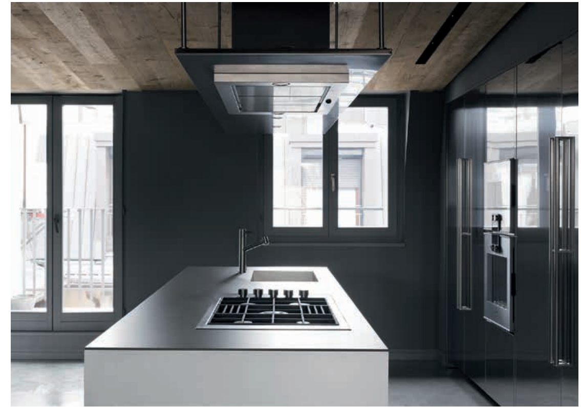
APRILE / Cucina Kitchen HIDE / Colonne Tall units FLAT KAP / Cappa Hood pag. 124 125, 126 127, 128, 129