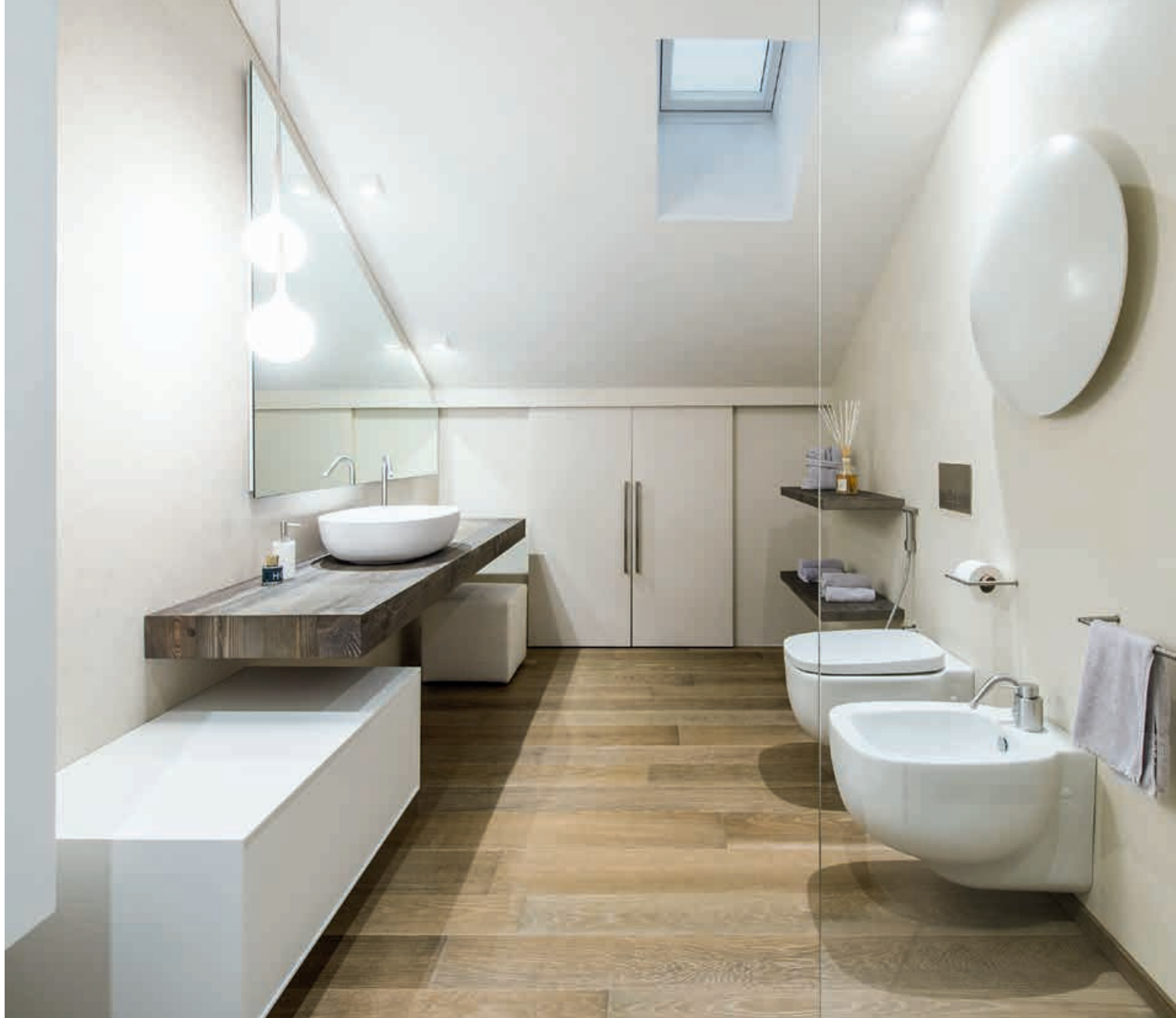
FLYER / Mobili Cabinets ICELAND / Lavabo Washbasin MINIMAL / Rubinetti Taps MINIMAL / Accessori Accessories pag. 198, 199