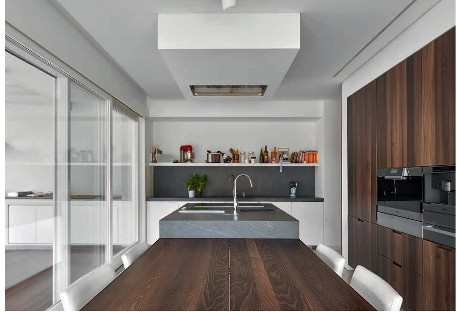
DUEMILAOTTO / Mobili Cabinets pag. 174 175, 176, 177