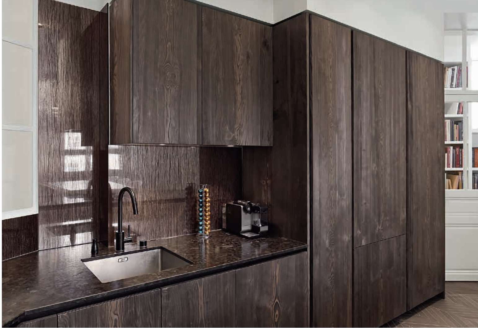
XILA / Cucina Kitchen pag. 102 103, 104, 105