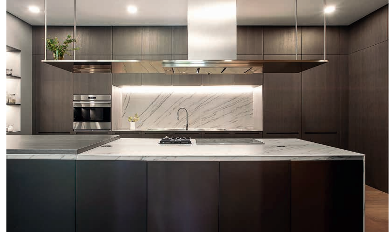
APRILE / Cucina Kitchen FLAT-KAP / Cappa Hood pag. 116 117, 118, 119