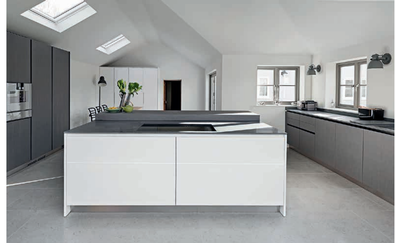
XILA / Cucina Kitchen DD1-F / Cappa Hood PROGRAMMA STANDARD / Colonne con maniglia Duemilaotto Tall units with Duemilaotto handle pag. 84 85, 86, 87