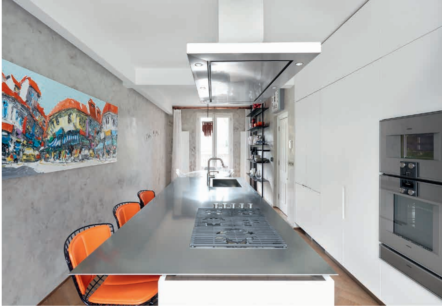
K14 / Cucina Kitchen PROGRAMMA STANDARD / Colonne con maniglia Duemilaotto Tall units with Duemilaotto handle BROMPTON / Libreria Bookcase pag. 80 81, 82, 83