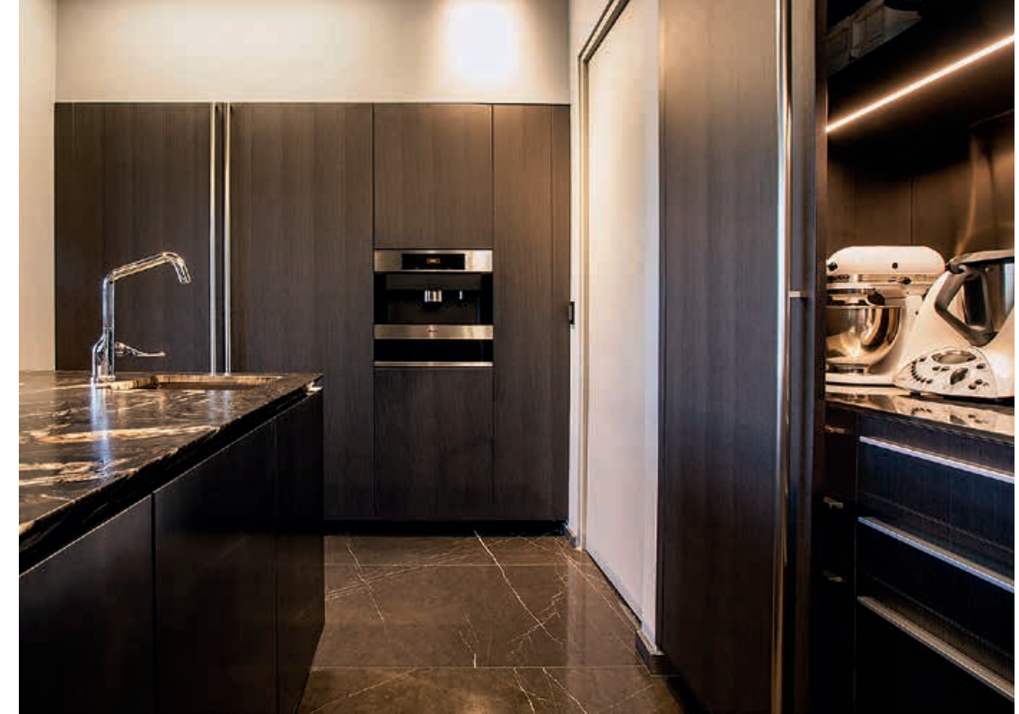
K14 / Cucina Kitchen HIDE / Colonne Tall units KAPPA / Cappa Hood pag. 112 113, 114, 115