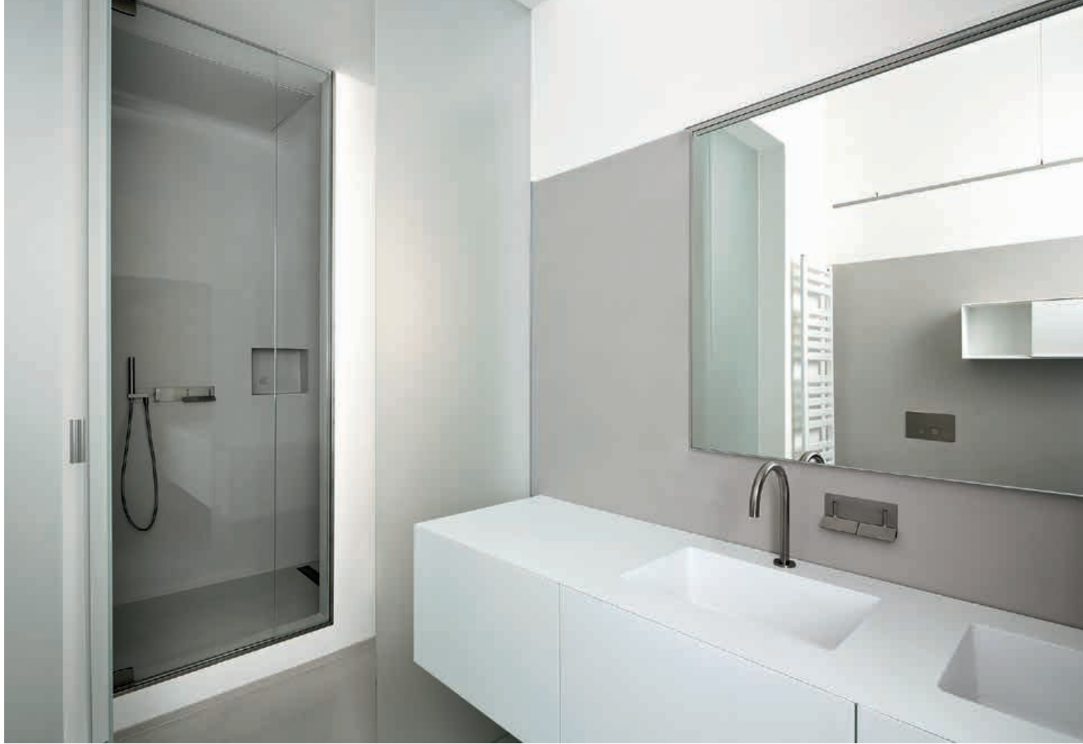
I FIUMI ST / Mobili Cabinets WINGS / Rubinetti Taps WK6 / Specchio Mirror OTHELLO / Specchio contenitore Cabinet with mirror GIÒ / Lampada Lamp pag. 236 237, 238, 239